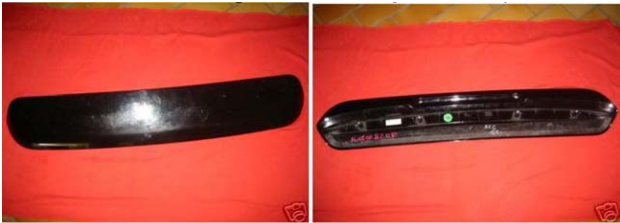
Bilder von mir ersteigerten DKS bei ebay!

Der originale DKS passt an den normalen Audi A3 nicht ohne eine gewisse Modifikation, da der Spoiler beim S3 geschraubt und mit Kleber fixiert wird!